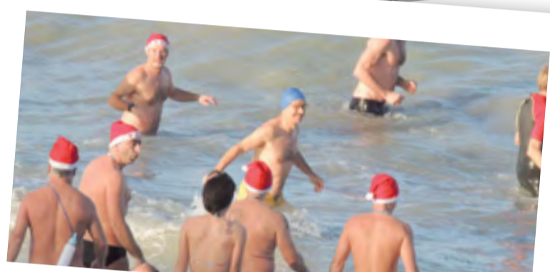
le bain des Manchots