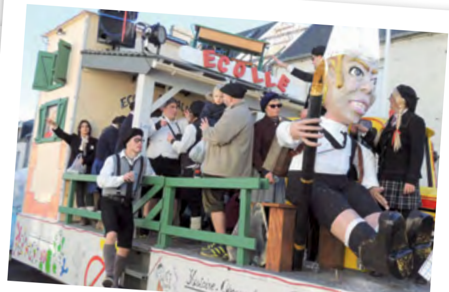
le char donvillais