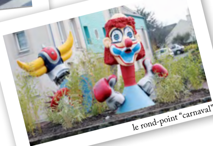
le rond-point "carnaval"